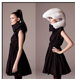
Hövding - den osynliga cykelhjälm.

Möjligheterna har också blivit större att uttrycka sig och sin stil i valet av hjälm, cykelväska och cykelkläder. J Lindeberg har bl.a. designat cykelkostym och en elegant blazer med liknande egenskaper som hos en funktionsjacka, Paul Smith säljer cykelhjälm och sadlar, och en rad företag erbjuder hipa cykelväskor. Den svenska krockkuddeinspirerade hjälmen Hövding har vunnit det mycket prestigefyllda designpriset Index: Award.