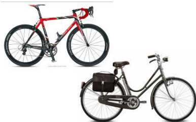
Ferrari- och Gucci-cyklar.

I programmet Stil i Sveriges Radios P1 ställdes nyligen frågan om cykeln är på väg att bli ett moderiktigt livsstilsattribut. Några designers som normalt inte verkar inom cykelsektorn erbjuder nu produkter för mer stilfull cykling. I samarbete med "riktiga" cykeltillverkarna har företag som Chanel, Hermes, Gucci, Missoni och Ferrar gjort modeller i begränsade upplagor.